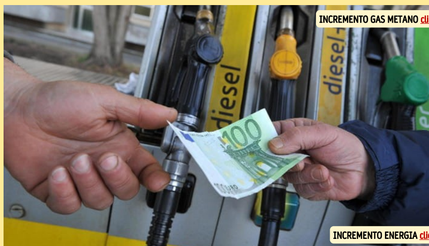
INCREMENTO GAS METANO clicca qui